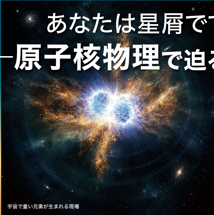
宇宙で重い元素が生まれる現場