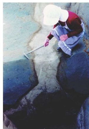
内里八丁遺跡の 液状化跡 →