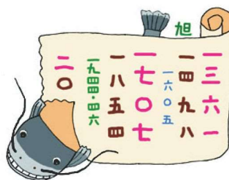
← 南海トラフ地震 イラスト © 寒川旭