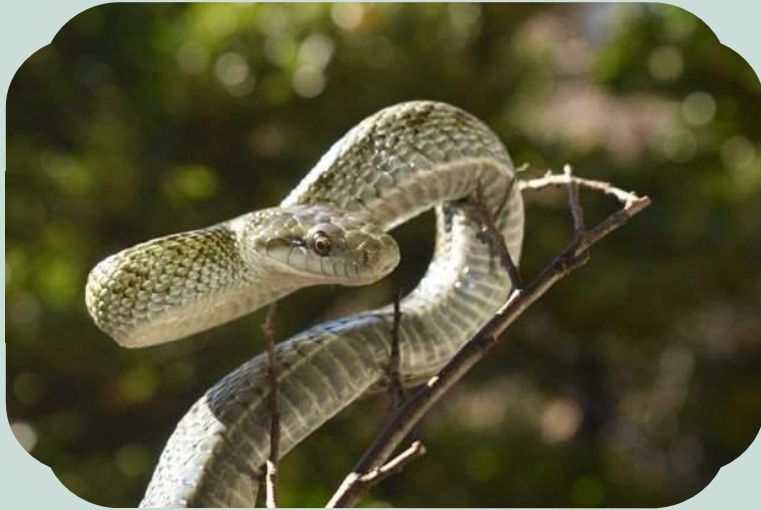
【アオダイショウ】

細くて長い体ですばやく動きまわり、茂みなどから突然現れたりするへび。どうにもへびが好きになれない方は多いようですが、へびは古来より日本人々と深いつながりをもっていた生きもののひとつです。今回はへびのユニークな特徴や人との関係について、お話しいたします。