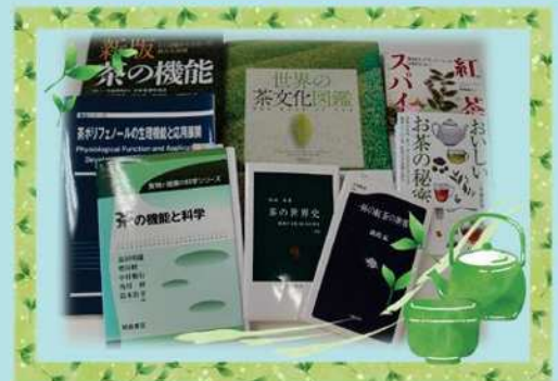
講師が集めた茶に関する書籍

本講座では、茶の種類によって異なる点や、チャ特有のポリフェノールであるカテキン類に期待される健康効果とその作用メカニズムに関する知見を解説します。さらに、カテキン類の酸化を防ぐために市販の茶飲料に添加されているビタミンCの影響についても最新の研究成果を紹介します。