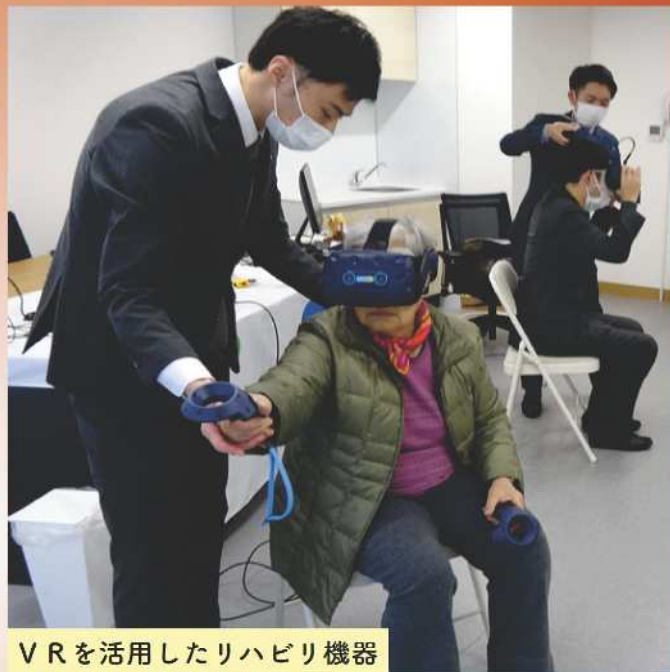
VRを活用したリハビリ機器

「高齢者の在宅生活を支える」拠点として、令和5年12月に三鷹市福祉 Labo どんぐり山がオープンしました。どんぐり山には、「在宅医療・介護研究センター」「介護人財育成センター」「生活リハビリセンター」という3つの機能があります。